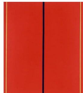
ברנט ניומן, מי מפחד מאדום, צהוב וכחול II, 1969-70